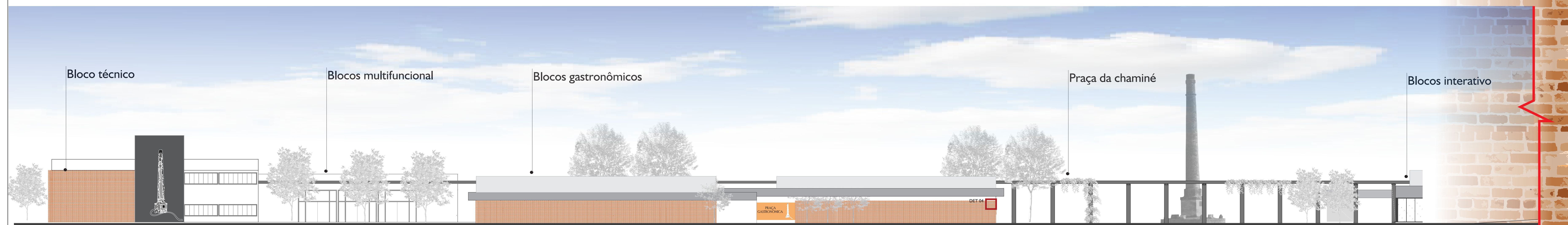
Fachada leste - esc 1:200