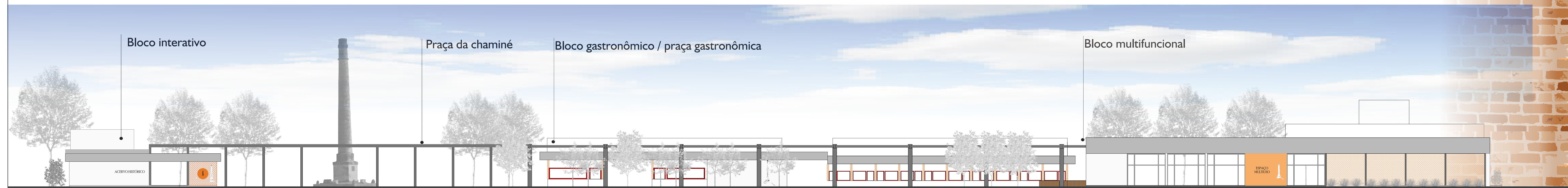
Fachada oeste - esc 1:200